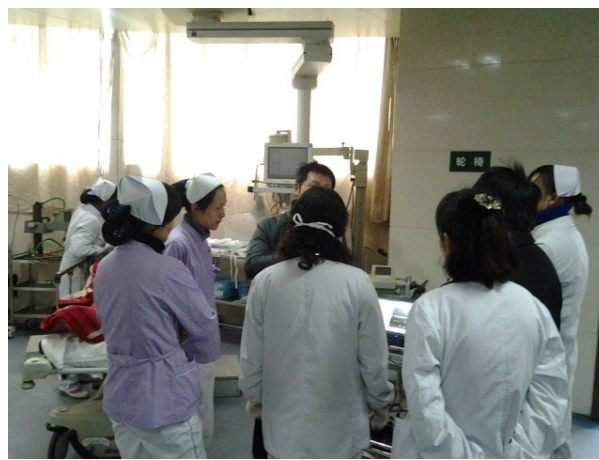
武汉大学中南医院培训