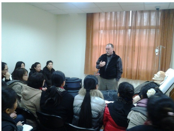
上海复旦护理学院培训

要真正发挥模拟教育的力量，必需有效运用模拟培训工具。所谓「工欲善其事 必先利其器」。为了让客户更了解和熟悉模拟人的操作方法，挪度公司提供两天制的模拟人教育课程。让客户从熟悉模拟人功能，操作软件系统到编写及运行病例。以便有效将模拟培训和现有课程整合，满足学习目标。